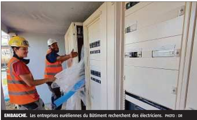
EMBAUCHE. Les entreprises euréliennes du Bâtiment recherchent des électriciens.

Le groupe réunit plusieurs sociétés : SDE Génie électrique, spécialisée dans les bâtiments tertiaires et industriels, SDE C2AI, spécialisée dans l'automatisme et le câblage d'armoires électriques, et SDE Habitat, spécialisée dans l'électricité résidentielle. Le groupe dispose également de différents pôles de compétences : administratif, RH, logistique, commercial, bureau d'études et d'un