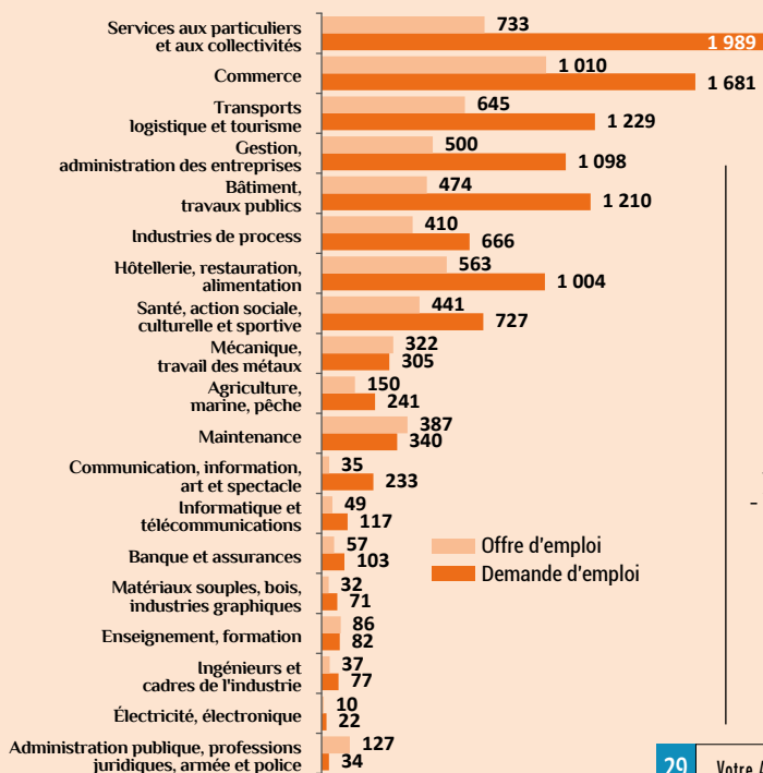
Offre émises et demandes d'emploi enregistrées par famille de métiers